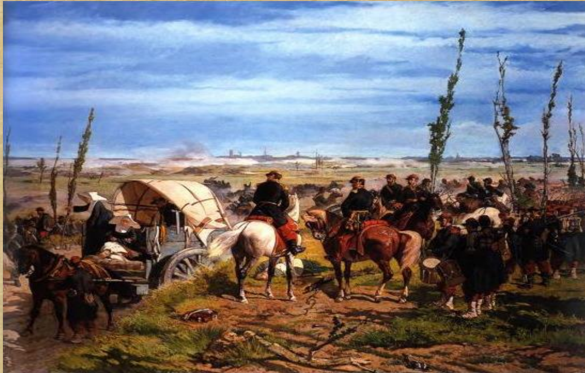
Giovanni Fattori –” il campo italiano alla battaglia di Magenta”

Il dipinto rappresenta uno degli episodi più noti della seconda guerra di indipendenza italiana , ovvero la Battaglia di Magenta .