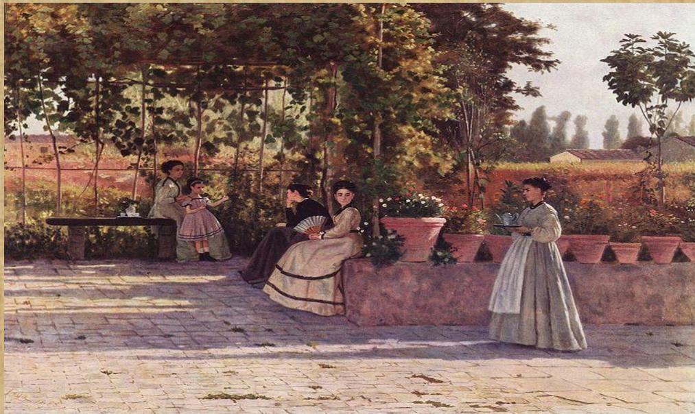
Silvestro Lega " Il pergolato" 1866 – Milano Pinacoteca di Brera

La prospettiva : soprattutto nel pavimento si nota la cura con cui l'artista dà l'illusione della profondità: le macchie diminuiscono di ampiezza via via che ci si avvicina alla fine del pergolato.