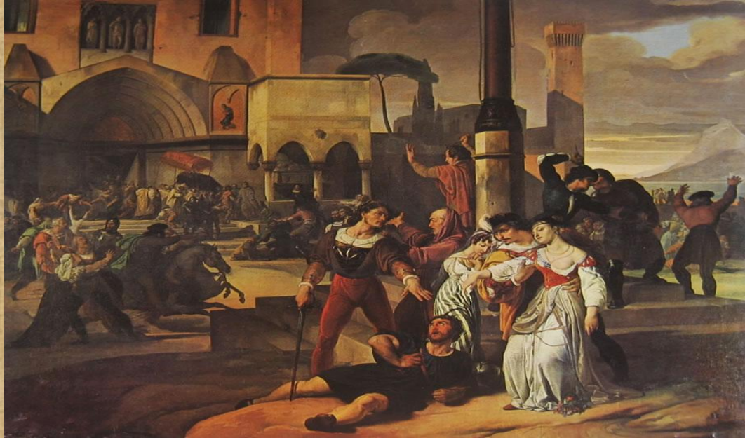
Francesco Hayez "I Vespri Siciliani"- Prima versione

L'episodio dei Vespri siciliani acquistava il significato simbolico, nell'ottica risorgimentale, di rivolta contro lo straniero. Gli angioini erano francesi ed è da ricordare che l'Italia, ancora nell'Ottocento, era suddivisa in tanti stati che erano dominati da dinastie o potenze straniere: i Borboni nel mezzogiorno , gli austriaci nel lombardo-veneto , e così via. Pertanto l'unità d'Italia andava perseguita affermando gli interessi degli italiani contro quelli degli stranieri.