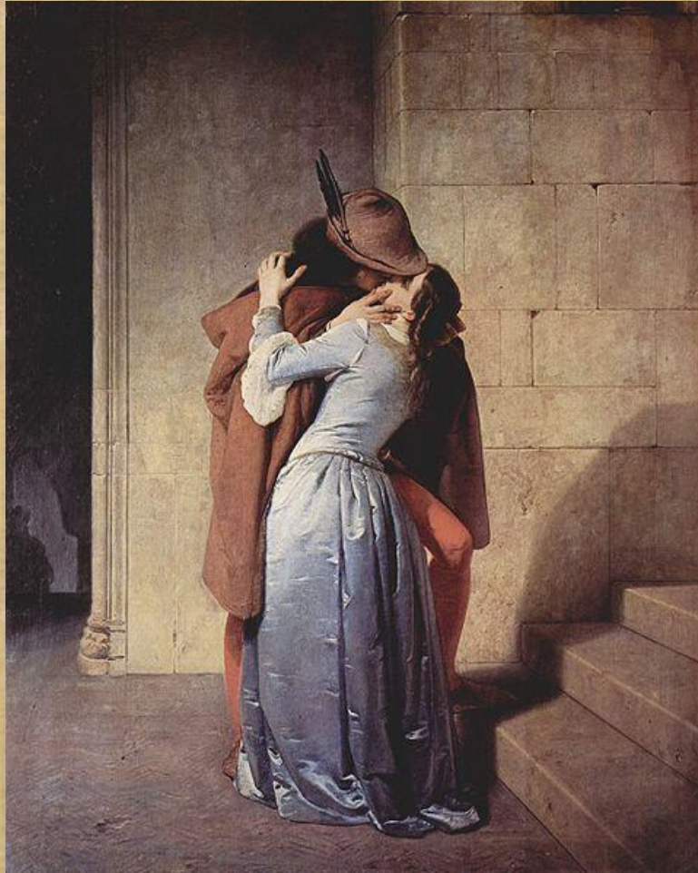
F.Hayez "Il bacio" – 1859 Pinacoteca di Brera - Milano

... Per la prima volta viene espresso in un quadro un bacio passionale e carico di emotività .