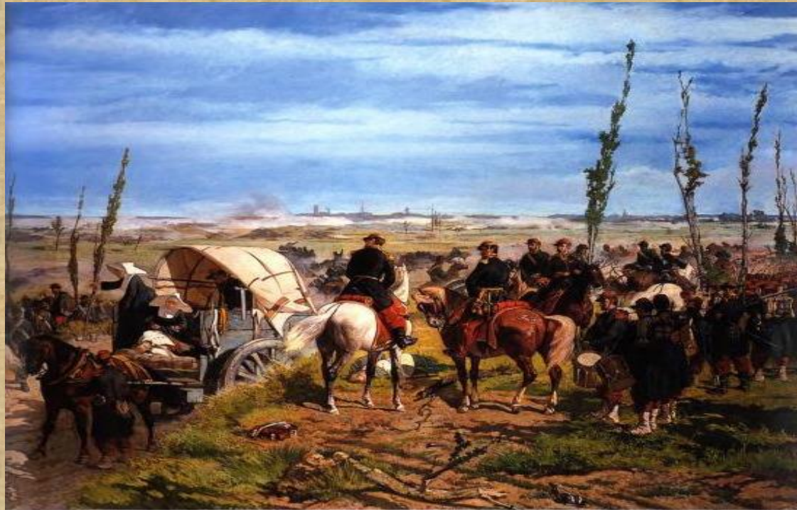
Giovanni Fattori –" il campo italiano alla battaglia di Magenta"

La composizione è asciutta ed equilibrata, ma non si può ancora definire macchiaiola per via della permanenza delle regole accademiche: disegno e chiaroscuro.