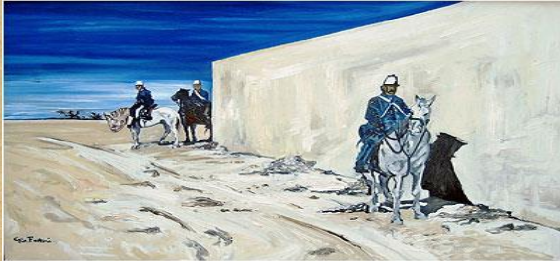
Giovanni Fattori - "Muro bianco" 1872

Alcuni soldati, impegnati in pattuglia, sono visti come vittime in un paesaggio desolato , dominato da un'intensa luminosità. Il senso della prospettiva è dato dalla parete sulla destra , la cui perfetta geometria interrompe con un taglio netto la linea dell'orizzonte, dove l'ocra della brulla pianura si confonde con l'azzurro violaceo del cielo.