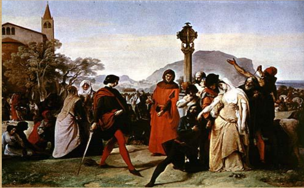
F.Hayez "I Vespri Siciliani" 1846 - Galleria Nazionale D'Arte Moderna - Roma

Il quadro illustra l'episodio in maniera molto letteraria ma poco emozionante. Le figure sono scandite secondo pose molto teatrali che risentono ancora dei quadri storici neoclassici del David.