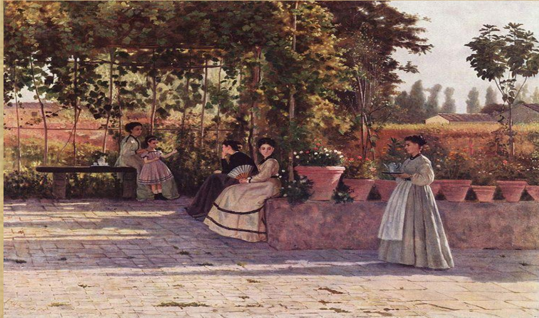
Silvestro Lega " Il pergolato" 1866 – Milano Pinacoteca di Brera

Silvestro Lega raffigura una semplice scena domestica: quattro figure femminili siedono sotto un pergolato, mentre una cameriera porta una caffettiera su un vassoio. La bambina in fondo alla scena, appoggiata alla madre, ha le braccia aperte e le mani levate come se stesse recitando una poesia alla signora vestita di nero che l'ascolta con apparente attenzione. In realtà l'atmosfera del quadro è ricca di un forte senso di "attesa". Di "che cosa"? o, meglio, di "chi"? Forse il pensiero di queste donne è rivolto ai loro uomini che sono al fronte?