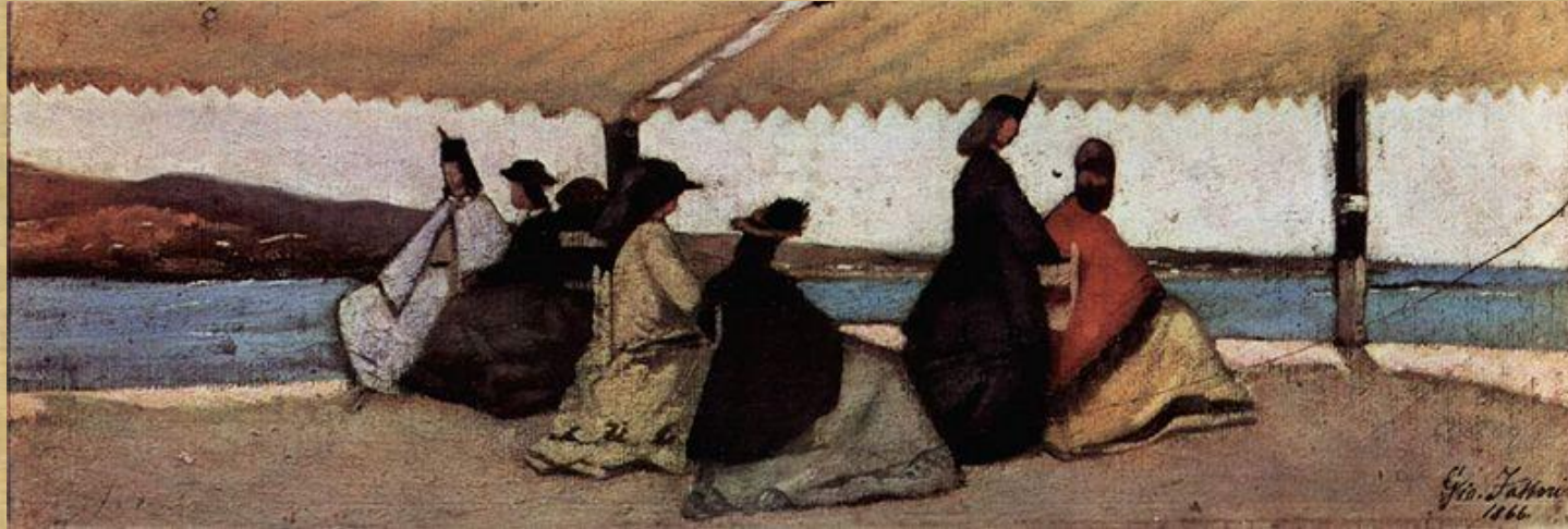
Giovanni Fattori - "Rotonda dello stabilimento balneare "Palmieri" 1866

La luce, l'acqua e l'atmosfera danno un senso di vivacità e immediatezza, ma in realtà alla base dell'opera si trova una lenta meditazione sul lavoro e uno studio attento , come si evince dai numerosi disegni preparatori che mostrano ripensamenti, osservazioni dal vivo, cambiamenti e rielaborazioni in studio.