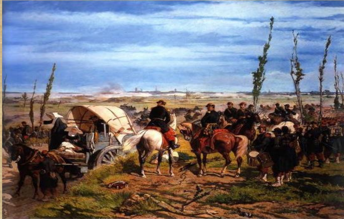
Giovanni Fattori – " il campo italiano alla battaglia di Magenta"

La parte destra è occupata da una serie di truppe schierate, il che fa comunque ricordare il contesto bellico in cui ci si trova ad agire, rammentato da un bellissimo sfondo che rappresenta la città di Magenta (appena abbozzata), dove ancora i fumi dei cannoni fanno intuire che lo scontro è all'attivo, ma è ormai giunto al termine.