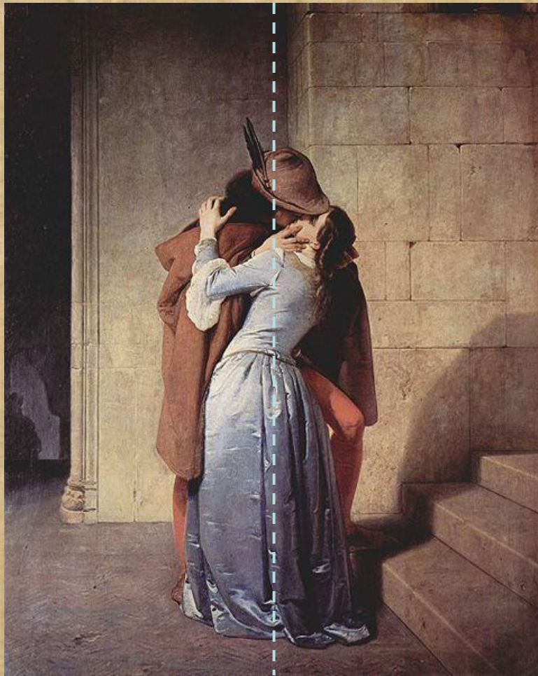
F.Hayez " Il bacio" – 1859 Pinacoteca di Brera - Milano

Hayez attraverso i colori (il bianco della sottoveste, il rosso della calzamaglia, il verde della piuma sul cappello e del risvolto del mantello e infine l'azzurro dell'abito della donna) vuole rappresentare l'alleanza avvenuta tra l'Italia e la Francia ( accordi di Plombières ).