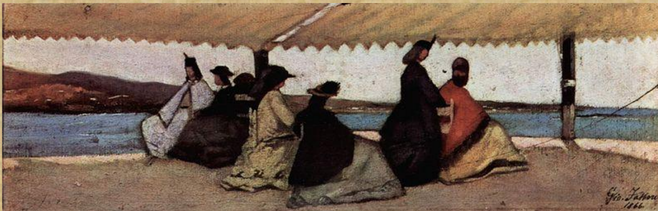
Giovanni Fattori - "Rotonda dello stabilimento balneare "Palmieri" 1866